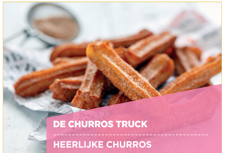
DE CHURROS TRUCK HEERLIJKE CHURROS