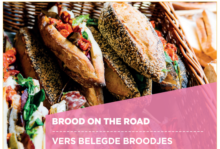
BROOD ON THE ROAD VERS BELEGDE BROODJES