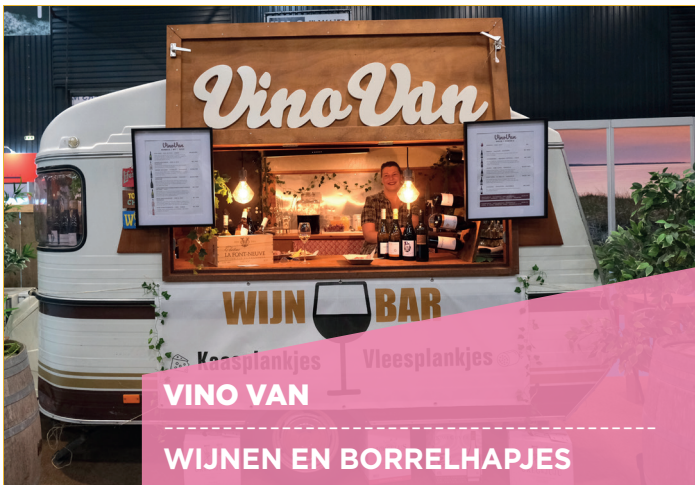
VINO VAN WIJNEN EN BORRELHAPJES