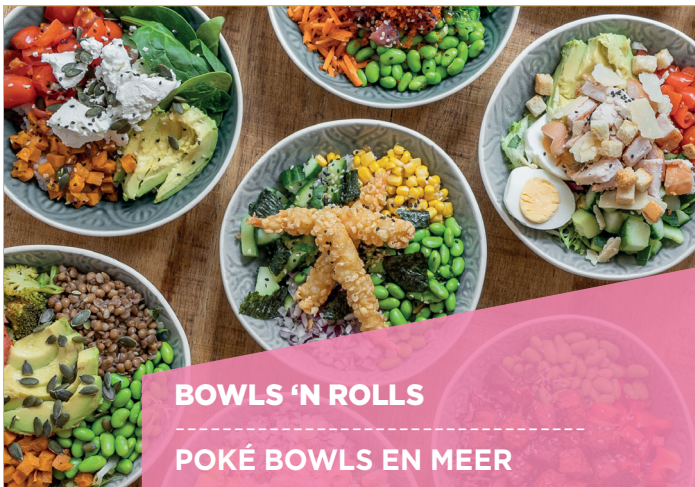
BOWLS 'N ROLLS POKÉ BOWLS EN MEER